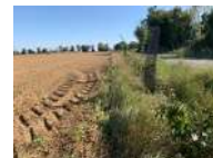
France – Plantations de haies bocagères par des agriculteurs en Normandie