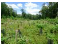
France – Forêt Montmorency : Plantation d'arbres pour remplacer des châtaigniers malades