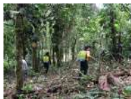
Equateur : Reforestation participative en Amazonie équatorienne