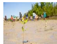
Madagascar - Projet pédagogique de plantation de mangrove pour restaurer les ressources naturelles et lutter contre l'insécurité alimentaire