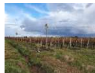
France – Plantation d'arbres au milieu des vignes en Saint-Emilion, Gironde