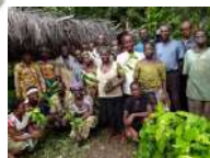
Togo - Agroforesterie et foresterie dans 5 villages de la vallée du fleuve Zio