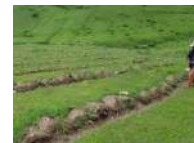
Arménie - reboisement en sylviculture et arbres fruitiers