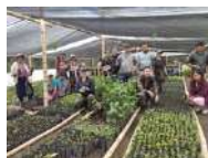
Colombie – Reforestation pour la conservation des páramos et la préservation de la ressource hydrique